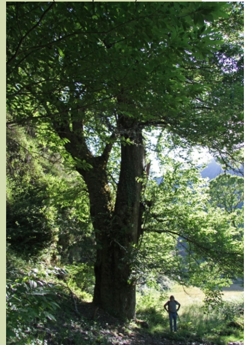
Castiñeiro na Ferrería Vella (-6,70 m de perímetro)