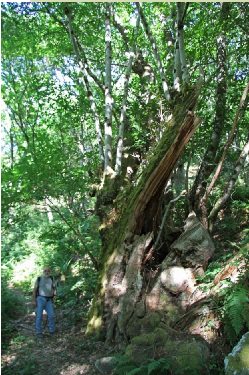
Castiñeiro na Ferrería Vella (-9,30 m de perímetro)