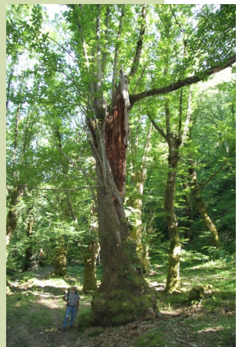
Castiñeiro no Souto de Mercurín (-6 m de perímetro)