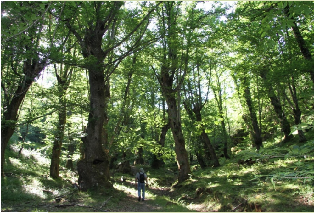
Souto de Mercurín