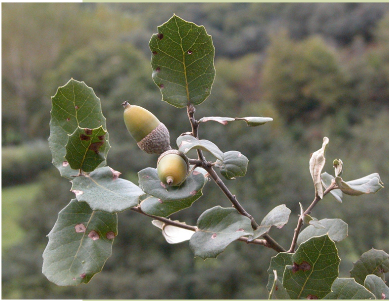
Follas e landras de aciñeiras.