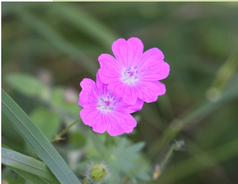
Geranium sanguineum , un xeranio típico das áreas de montaña.