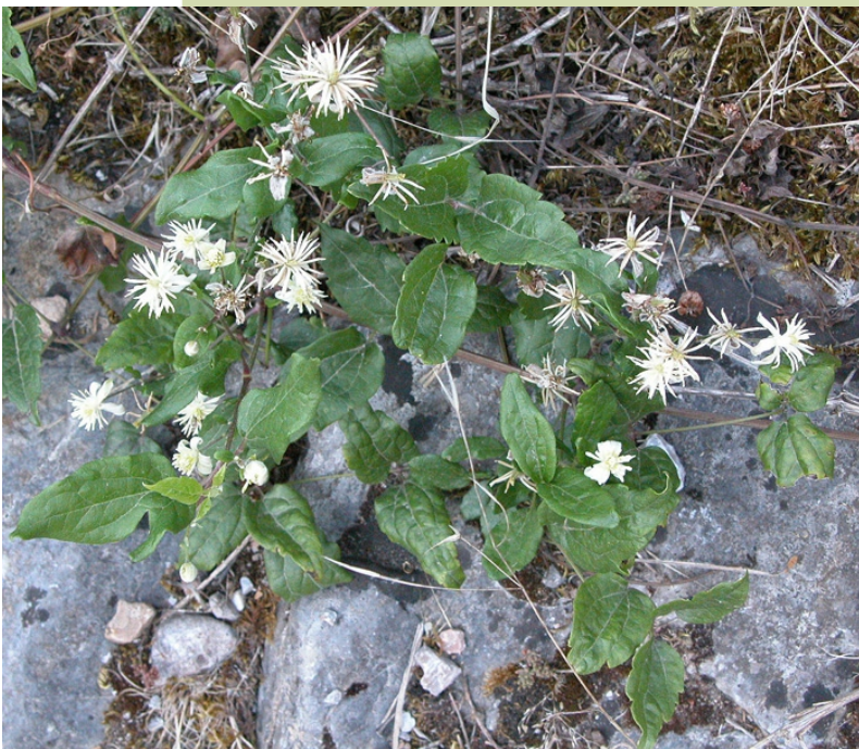
Herba do pobre ( Clematis vitalba ), unha pranta gabeadora típica dos terreos calcários.