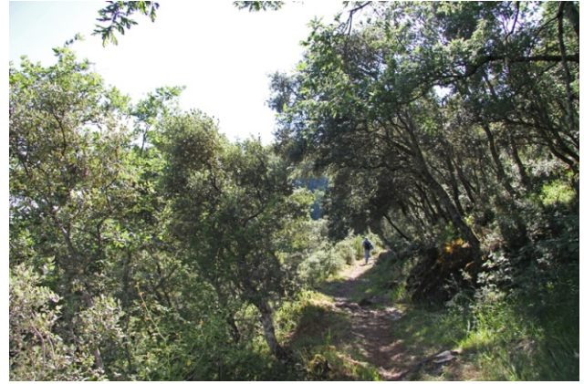
Vista do interior e do exterior do aciñeiral de Mercurín