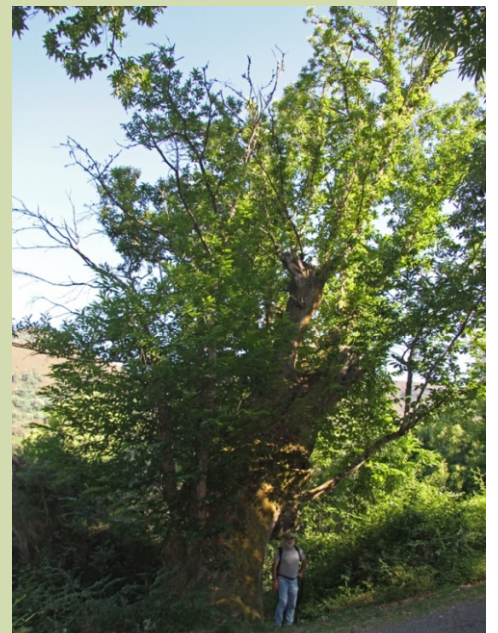
Castiñeiro na Ferrería Vella (-6,50 m de perímetro)