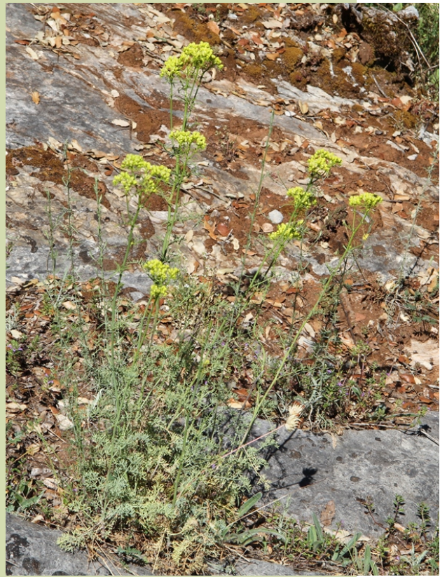
Ruda ( Ruta montana ). Vive nos terreos secos da montaña.